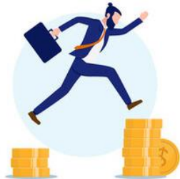
สิ่งที่ควรส่งเสริม